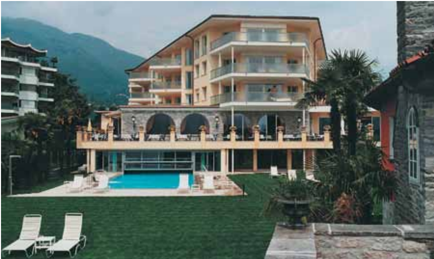
Planung: Tami & Associati SA, Gordola / Ausführung: A. Bai e Figlio, Ascona

Hotel Eden Roc, Ascona 27 Luxus-Suiten, Fitnesscenter, Sauna, Hallenbad und 2 Pools