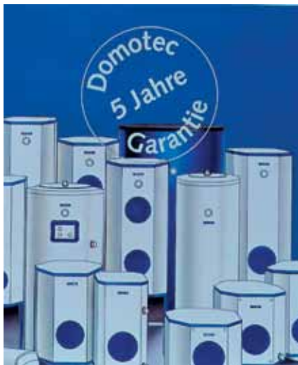
5 Jahre Garantie auf alle Teile