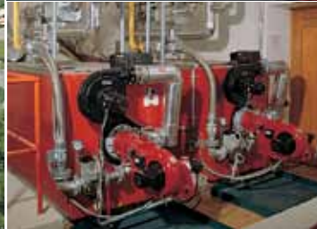
Wäckerlingstiftung Uetikon am See 125 Betten, Physiotherapie, Küche, Lingerie

Planung: Schneider & Aebi, Solothurn / Ausführung: Lehmann & Billeter AG, Meilen