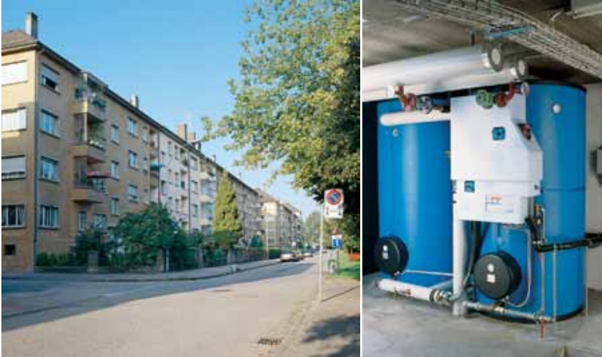
Planung: Max Bein, Ing.Büro, Oberdorf / Ausführung: Sulzer Infra Nordwestschweiz AG, Solothurn

Wohnsiedlung Rötiquai, Solothurn 80 Drei- bis Vierzimmerwohnungen