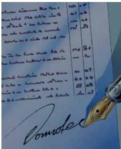
Serviceabo – gewährt hygienisch einwandfreie Wassererwärmung