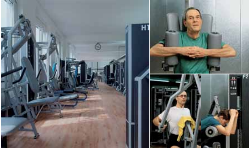
Planung und Ausführung: Saudan, Solothurn