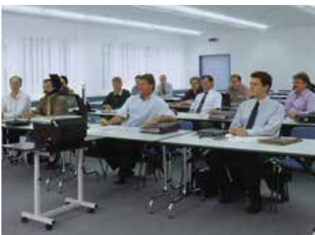
Syncro-Seminar in unserem Werk Aarburg

Für einen Seminartermin nehmen Sie bitte mit dem in Ihrem Gebiet zuständigen Domotec-Aussendienstmitarbeiter Kontakt auf oder melden Sie sich unter www.domotec.ch an.