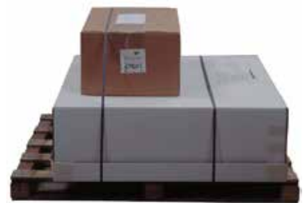
Ladegruppe mit Beipack