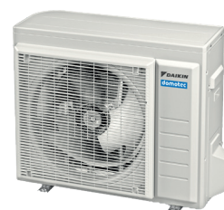
RAL 9016 Blanc signalisation