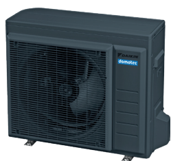
RAL 7016 Grigio antracite