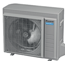
RAL 9006 Bianco di alluminio