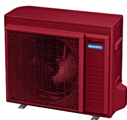
RAL 3003 Rosso rubino

Per la funzionalità, le unità esterne compatte della gamma delle pompe di calore HPSU sono essenziali. Sottraggono calore all'aria ambiente e la trasmettono all'unità interna. Ogni proprietario di case desidera che l'unità esterna si fonda in modo pressoché invisibile con l'ambiente circostante. Ecco perché offriamo ai nostri clienti la possibilità di scegliere le loro unità esterne in un colore che si adegui al meglio alla facciata e all'ambiente circostante. Di serie, le unità esterne vengono fornite in color avorio. Per ispirarvi, trovate in basso comunque alcuni campioni di colore quali grigio antracite, rosso rubino, bianco di traffico e bianco alluminio.